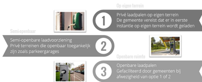
Figuur 1: Ladder van laden

Voor het laden van elektrische auto's wordt vaak uitgegaan van de zogeheten 'ladder van laden', zie figuur 1 hieronder.