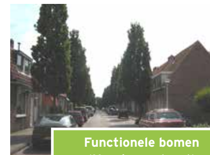
Functionele bomen (Narcissenstraat)