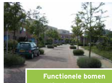
Functionele bomen (Centaurstraat)