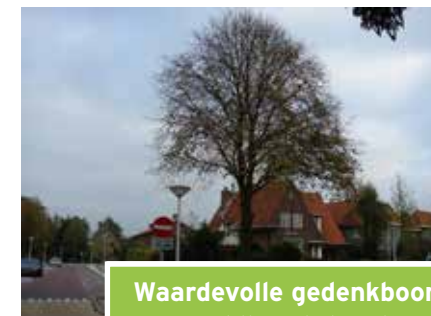
Waardevolle gedenkboom (Veldhorststraat)