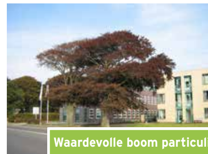
Waardevolle boom particulier (Heereweg)

De onderstaande foto's tonen voorbeelden van bomen in de drie categorieën.