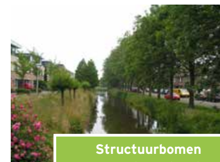
Structuurbomen (Jan Steenstraat)